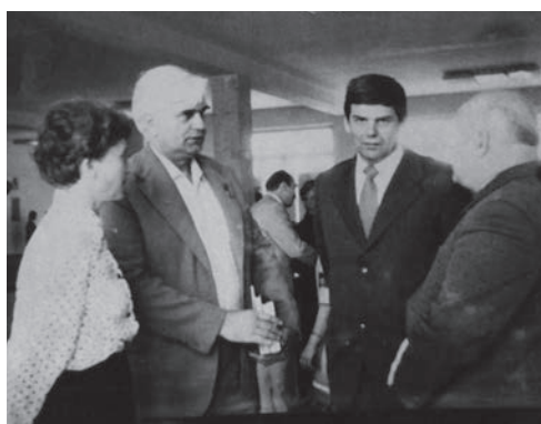
На полях VI Всероссийского съезда фтизиатров, г. Кемерово, 1987 год

тров, работу которого положительно оценили на заседании Президиума правления Всероссийского общества фтизиатров в марте 1985 года.