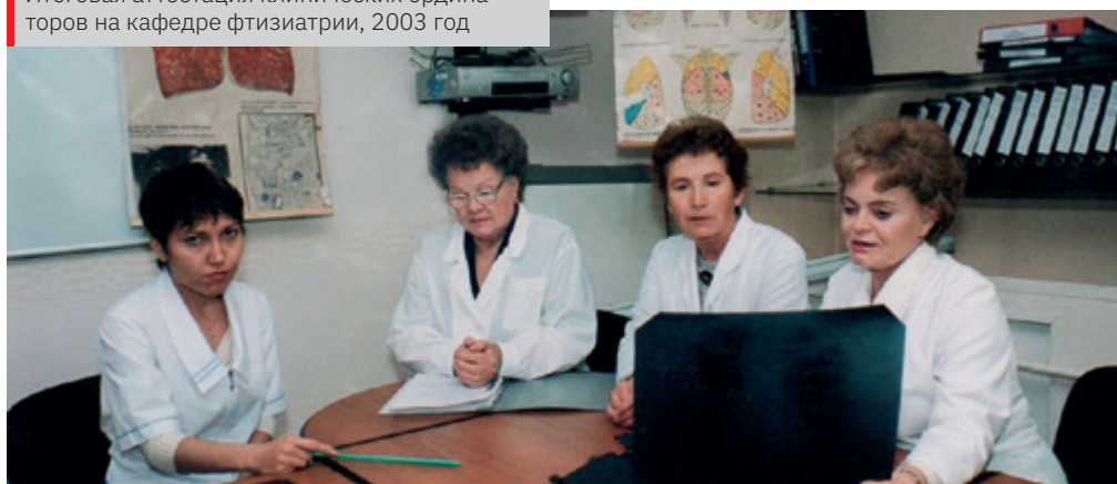
Итоговая аттестация клинических ординаторов на кафедре фтизиатрии, 2003 год