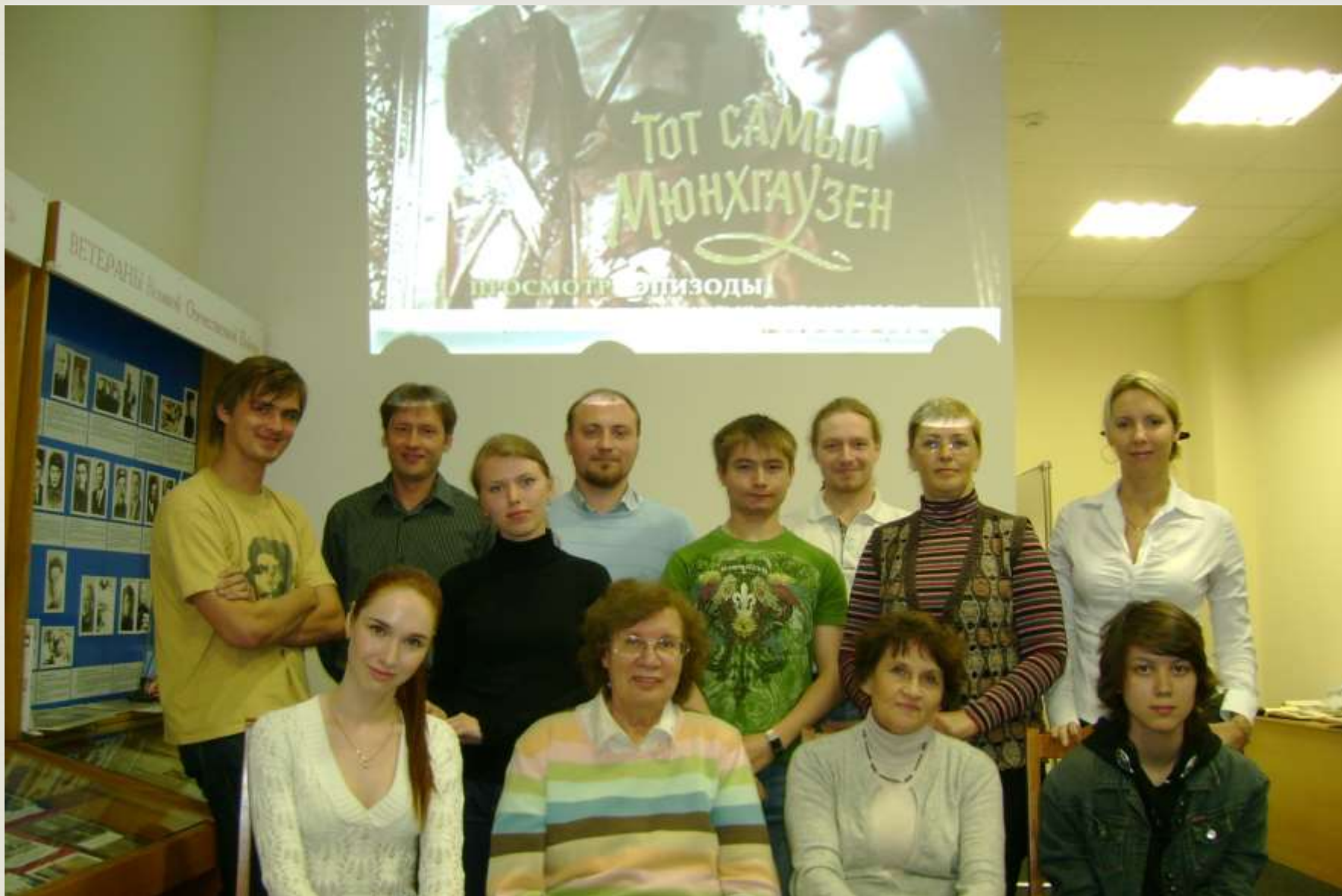
Клуб любителей интеллектуального кино