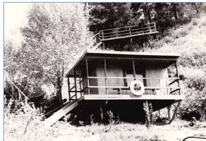
Оборудование лагеря отдыха в деревне Подьяково

Первые студенческие строительные отряды появились в институте в 1962–1963 гг ; ежегодно формировалось по 14–16 отрядов, а в рекордном 1982 г. их стало 20.