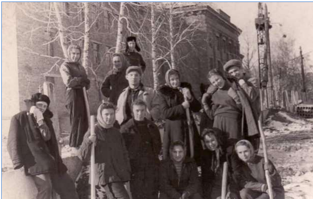
Перестройка санитарно-гигиенического корпуса

Первые студенческие строительные отряды появились в институте в 1962–1963 гг ; ежегодно формировалось по 14–16 отрядов, а в рекордном 1982 г. их стало 20.