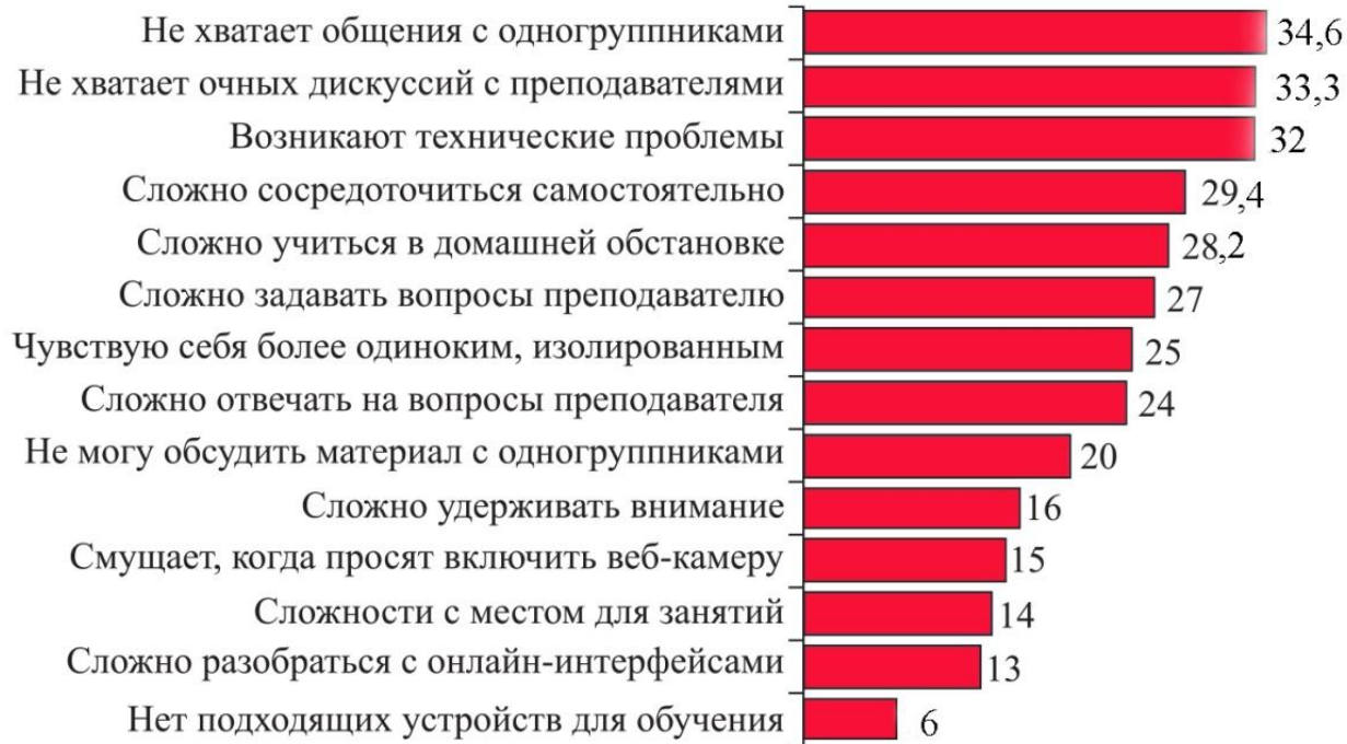
Рис.1. Оценка проблем с дистанционным обучением, % опрошенных студентов