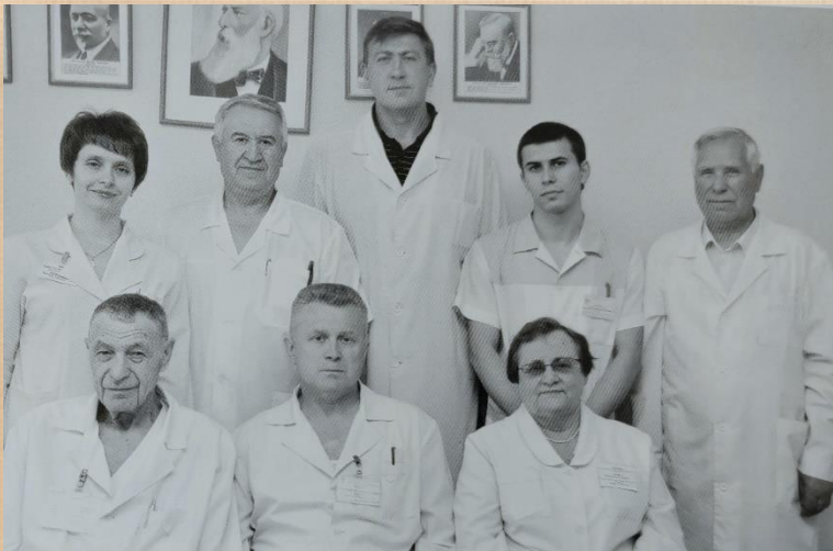
Коллектив кафедры. 2013 г.