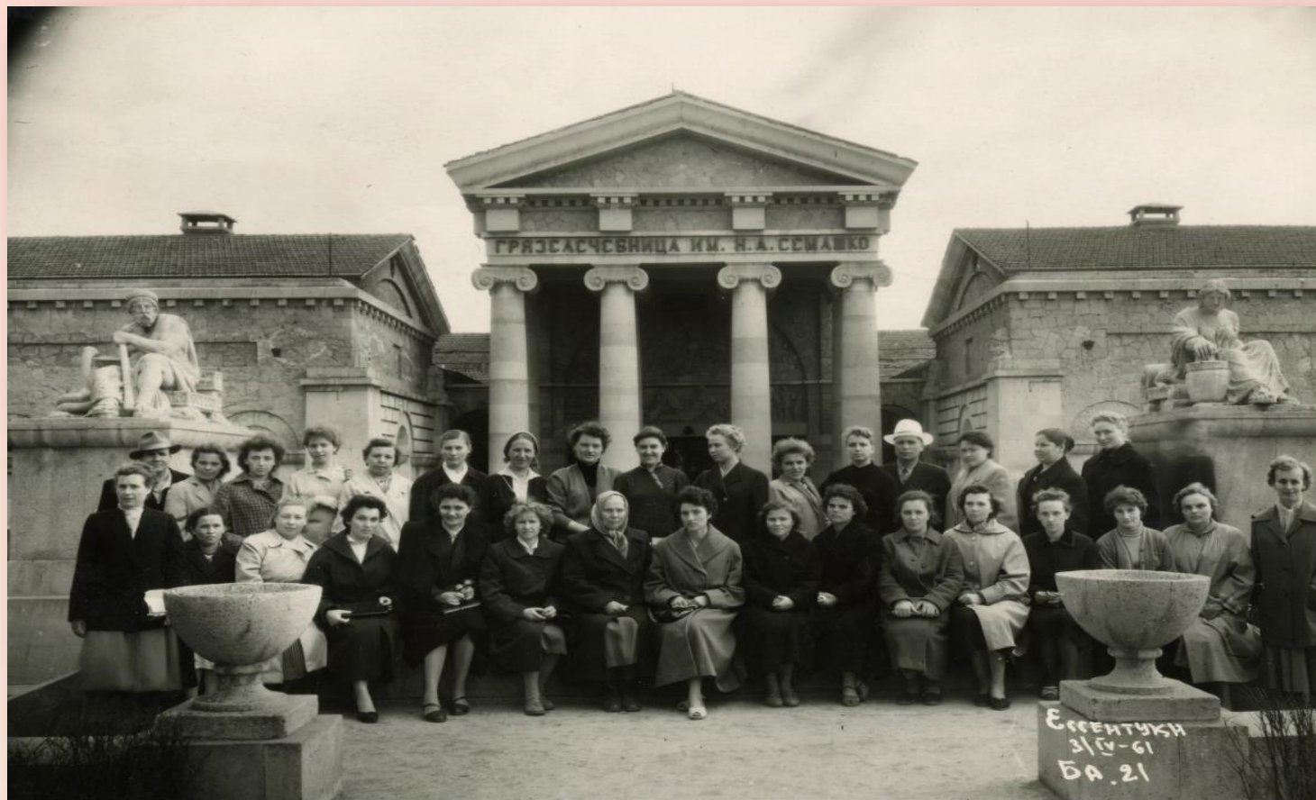
Грязелечебница им. Н. А. Семашко

Под руководством первого советского наркома здравоохранения начали появляться санатории и курорты. Например, в 1925 году специалисты переоборудовали Ливадийские дворцы Крыма под санатории на 500 коек, где бесплатно отдыхали и лечились крестьяне.