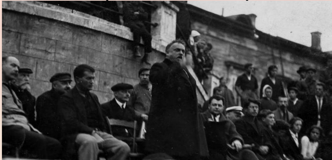
Выступление Николая Александровича Семашко

Вторым, не менее важным методом являлось увеличение количества противотуберкулёзных диспансеров и санаториев. По инициативе Семашко на контроль была взята система фильтрации воды в крупных городах. Параллельно на предприятиях начались появляться медсанчасти, в их обязанности входило оказание неотложной помощи, проведение профилактики и лечения профессиональных заболеваний. Кроме этого, медсанчасти выдавали путёвки в оздоровительные санатории.