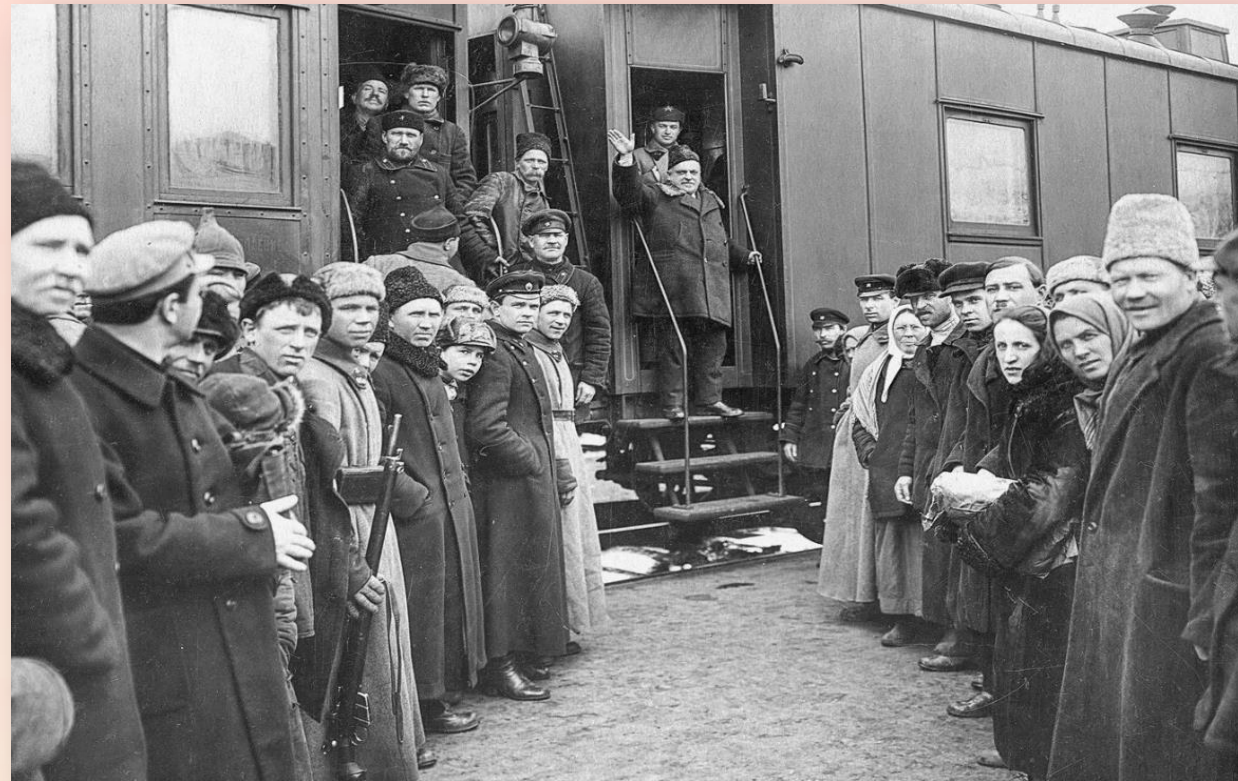
Семашко Н. А. в г. Пензе 1927 г.

Семашко говорил: «Пьянство и культура — вот два понятия, взаимно исключающие друг друга, как лёд и огонь, свет и тьма».