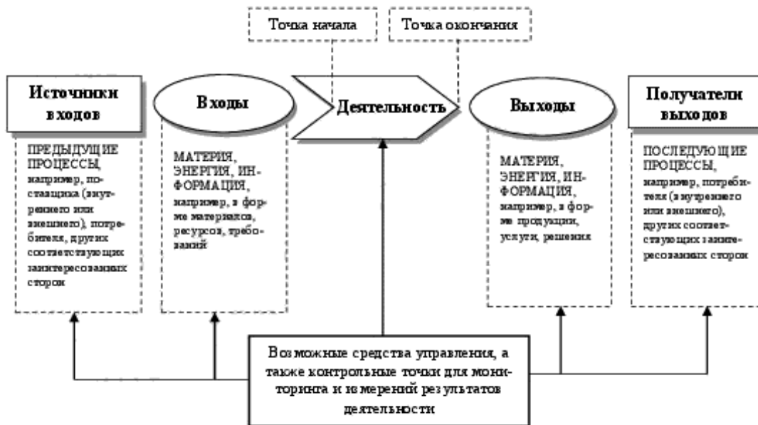
Рисунок 1 — Схематичное изображение элементов процесса

Рисунок 1 дает схематичное изображение любого процесса и иллюстрирует взаимосвязь элементов процесса. Контрольные точки мониторинга и измерения, необходимые для управления, являются специфическими для каждого процесса и будут варьироваться в зависимости от соответствующих рисков.