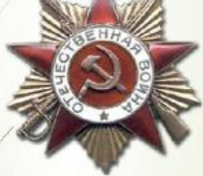
ОРДЕН ОТЕЧЕСТВЕННОЙ ВОЙНЫ I степени

Орден Отечественной войны I и II степени могли получить лица рядового и начальствующего состава Красной Армии, Военно-Морского Флота, войск НКВД и партизаны, которые проявили в боях с фашистами храбрость, стойкость и мужество либо своими действиями способствовали успеху боевых операций советских войск. Особо оговаривалось право на этот орден гражданских лиц, награждавшихся за вклад в общую победу над врагом.